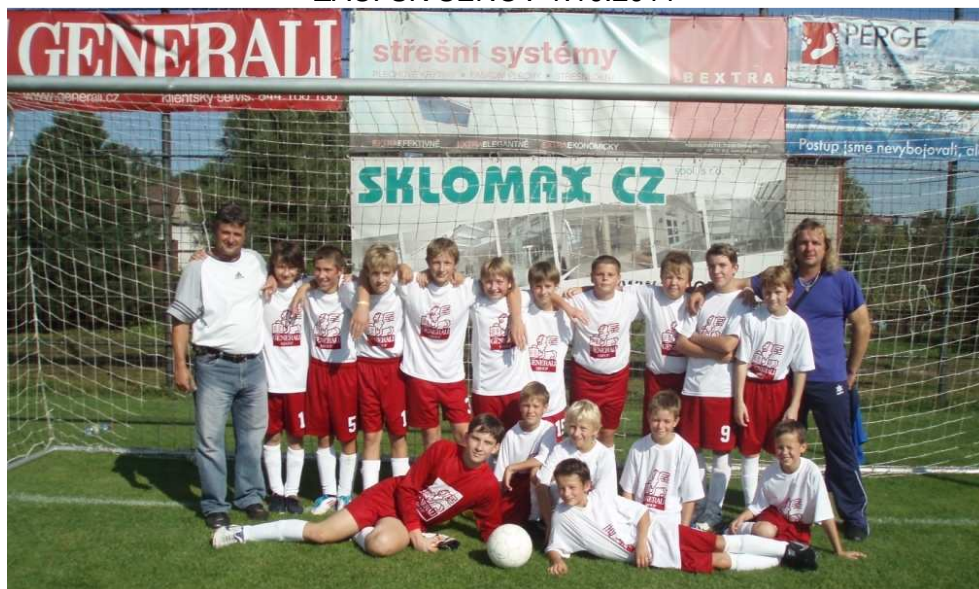
ŽÁCI SK ŠENOV 1.10.2011